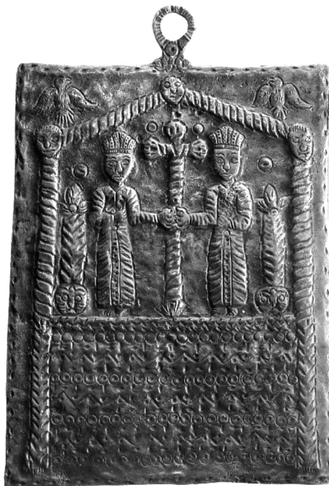
Фиг. 9. Нагръдна иконка от Янина, Епир. Бронзова отливка от края на XX в.

та краткотрайност на производството им, схематичността на изображенията, достигаща до примитивност, както и представянето върху тях на един утвърден иконен тип довел изглежда до развита се впоследствие спекула с тях, при което редките и поради това зле познавани образци били продавани на любители на старините като автентични образци на византийското изкуство, което от своя страна предизвикало реакцията на Стриговски да ги обяви за „фалшификати“. Забележително е и това, че веднъж харесан, типът се възпроизвежда и досега, макар и под формата на нагръдни иконки,