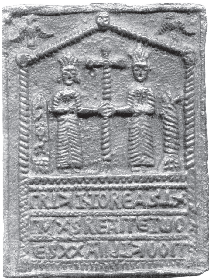
Фиг. 1. Бронзова плочка с изображенията на Св.Св. Константин и Елена от Археологическия музей в Пловдив

Преди десетина години, при разглеждането на археологическа изложба, организирана в Националния исторически музей, в която бяха представени предмети, събрани от няколко музея в страната, бях впечатлен от един непознат дотогава за мен паметник, отнесен от колегите ми от Пловдивския археологически