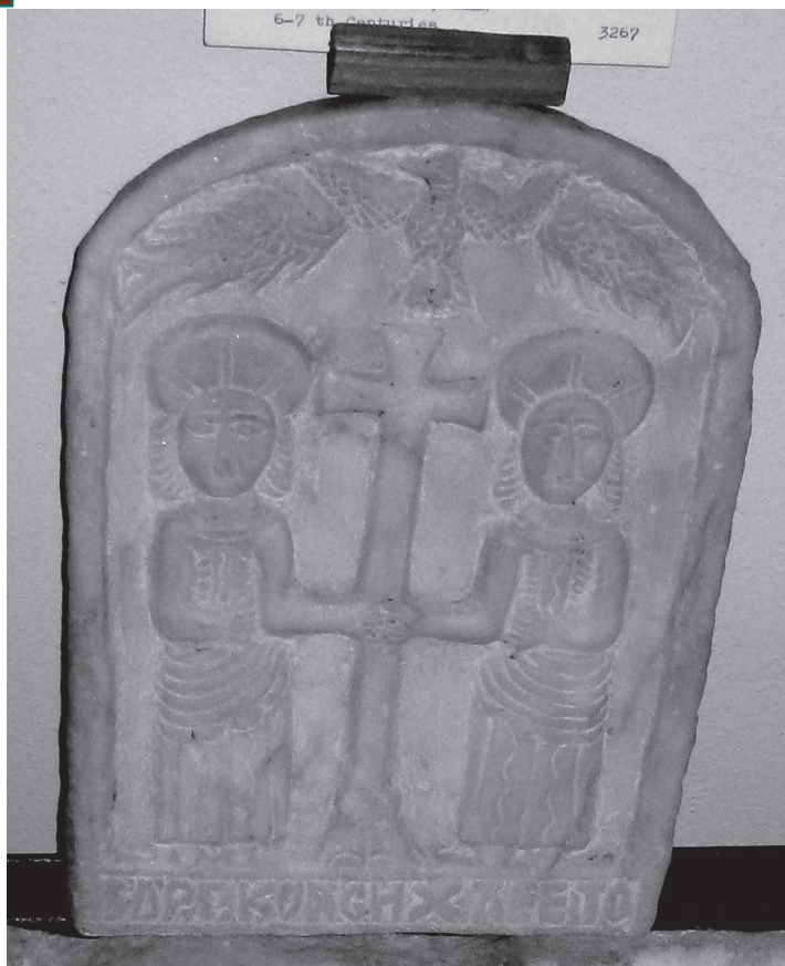
Фиг. 3. Мраморна плочка с изображенията на Св.Св. Константин и Елена от сбирките на НЦИАМ