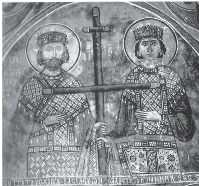
Фиг. 5. Фреска от църквата Панагия Форбиотиса в Асиниу, Кипър (по А. & J. Stylianos)

ображения (с най-голяма вероятност това на Форо Бовис, за което разполагаме със сигурно указание, че Св.Св. Константин и Елена държали помежду си сребърен позлатен кръст), така и с утвърдените вече от няколко столетия византийски монетни типове, при които били представяни император и императрица или двама съимператори държащи помежду си кръст или лабарум. Веднъж възприета и утвърдена иконографски, сцената Откриване на Честния кръст започнала все по-често да бъде представяна в произведенията на монументалната живопис и особено в обковките на реликвариите, в които се съхранявали частици от Кръста. Интересно е, че върху монетите, за които ще стане дума по-нататък тя се явява сравнително късно и е по-скоро нетипична. Нещо повече, първият монетен тип, върху който я виждаме се отнася към латинското монетосече-