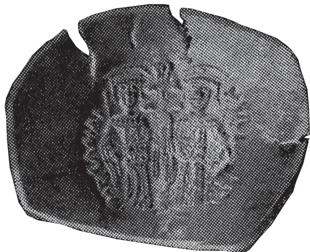
Фиг. 6. Медна голямомодулна монета, латинска имитация, с изображенията на Св.Св. Константин и Елена, намерена в Търново (по К. Дочев)

не в Солун (Фиг. 6). Впоследствие три малки, при това много късни емисии на медни торнезета от около 1400 година, две на император Мануил II Палеолог и една на императора-регент Йоан VII Палеолог, ще носят също техните изображения, но без поясняващи ги надписи 15 . Едва ли бих могъл да съставя пълен каталог с изображения на разглежданата сцена от времето, предхождащо османското нашествие на Балканите, тъй като тя вече била широко разпространена в целия православен свят, а и на Запад. Това не е и необходимо. Трябва да се отбележи обаче, че върху нито едно от познатите ми десетки изображения от периода, в сцената не са представени нито Теодосиевият обелиск, нито Змийската колона от константинополския хиподром, може би защото там никога не е имало изображения на Св.Св. Кон-