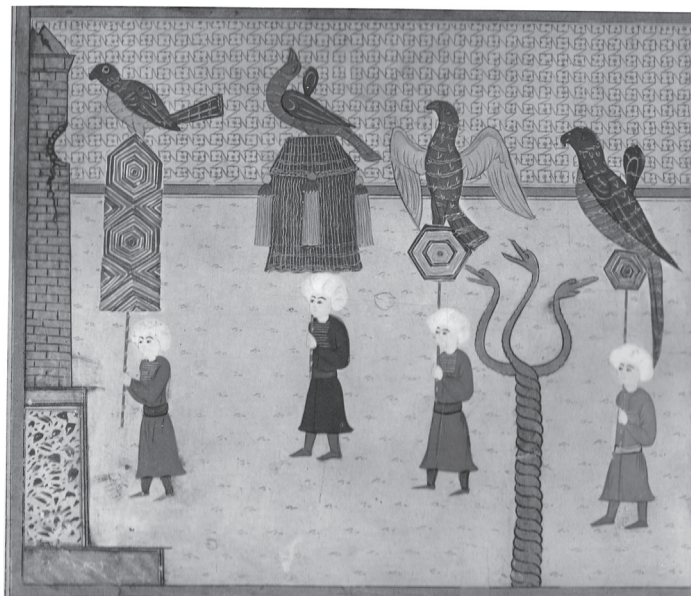
Фиг. 8. Змийската колона в Константинопол. Детайл от турска миниатюра от Книга на празниците (Сурнаме) от края на XVI век (според публикацията ѝ в сборника Turquie. Miniatures anciennes . New York Graphic Society. 1961, Pl. XXIV)

още два елемента от разглежданите па- метници, които указват също сравни- телно модерния им произход. Рамката тип „шнур“ е добре позната от иконите от XVII и XVIII векове. Това пластично оформление на техните рамки е дори толкова типично, че се приема и за от- носително точен датиращ ги елемент. Осемнадесетото столетие е и времето, когато, макар и сравнително рядко, традиционните арки над главите на светите образи в иконите се представя- ли и като двускатни покриви, подобно на тези от нашите плочки. По същото време в декорацията на ръкописните книги намират широко разпростра- нение (особено в инициалите) елемементи от човешки тела – предимно глави, в профил или “en face”, подобни на тези, които са представени в ъглите на двускатното покривче от разглежда-