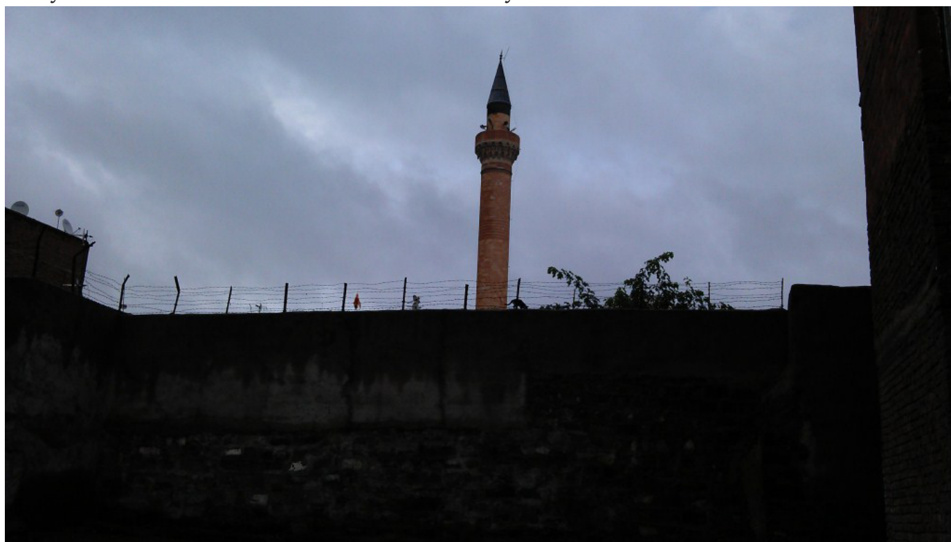
В бедните квартали, оградени със стени и тел.

елемент от една идея, която продължава да се развива и, която има значително влияние върху двете страни. Сега, когато сирийската гражданска война е в разгара си, ПКК става по-активна в Турция, която пък е разтърсена от бежански вълни и вътрешни политически спорове. Нестабилната турско-сирийска граница дава възможност за връзка и с кюрдите в Сирия. От друга страна, уредените вече в автономия кюрди в северен Ирак, Иракски Кюрдистан, дават пари за развитието на отделни градове в югоизточна Турция, като град Батман (на кюрдски – Êlih), който за своите 300 000 души население, има няколко търговски центъра, а надписите са почти изцяло на кюрдски. На всичкото отгоре областта около Батман е богата на петрол – още една причина за политически сблъсъци и желание на всяка от страните да има влияние тук.