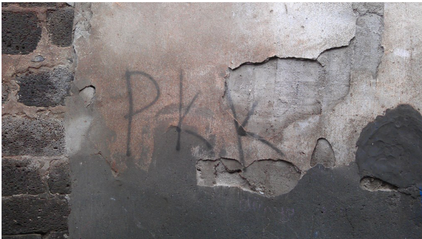
Снимка, направена в бедните квартали на Диарбекир. Стените са покрити с надписи, подкрепящи кюрдските бунтовници от PKK.

Кая – тъжна, тежка, караща човек да мисли, да се завие с емоциите си и да не излезе изпод тях с дни.