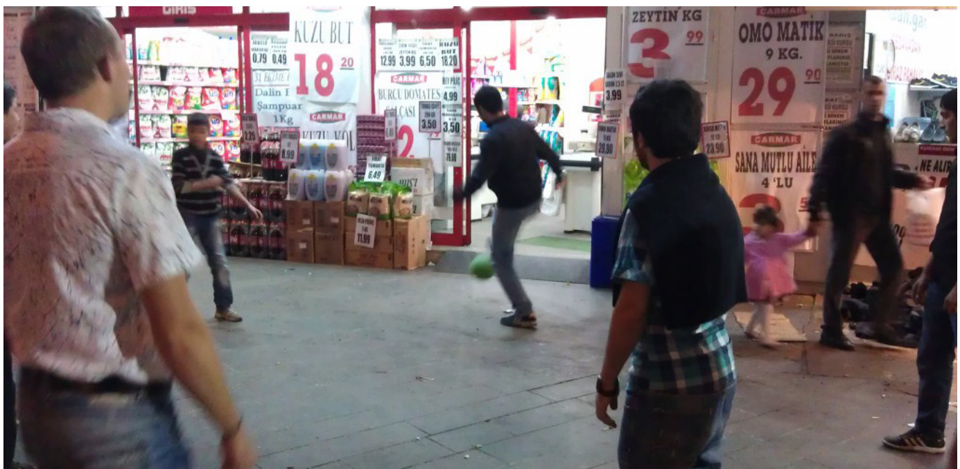
Момчета играят футбол пред супермаркет в Диарбекир.

този път напук на желанието на политиците да се възползват от бедността и несгодите. Спирането на тока в определен час също не помрачаваше настроението – вадеха се лампите и разговорите продължаваха, а уханиято на кафе се носеше навсякъде.