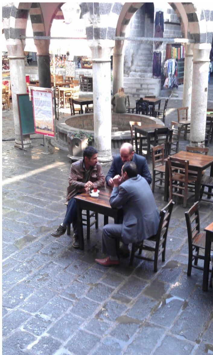
Мъже разговарят на по чаша черен чай в хана “Хасан Паша”.

то различни политически фракции използват основата на конфликта за свои цели. Диарбекир граничи с богат на природни ресурси район, един от тях е петролът. Именно в тези части, намиращи се в близост до иракската и сирийската граница, днес ПКК е най-активна и често биват нападени военни пунктове и техника. Кое то, разбира се, води до репресии срещу обикновените хора по селата и малките градове.