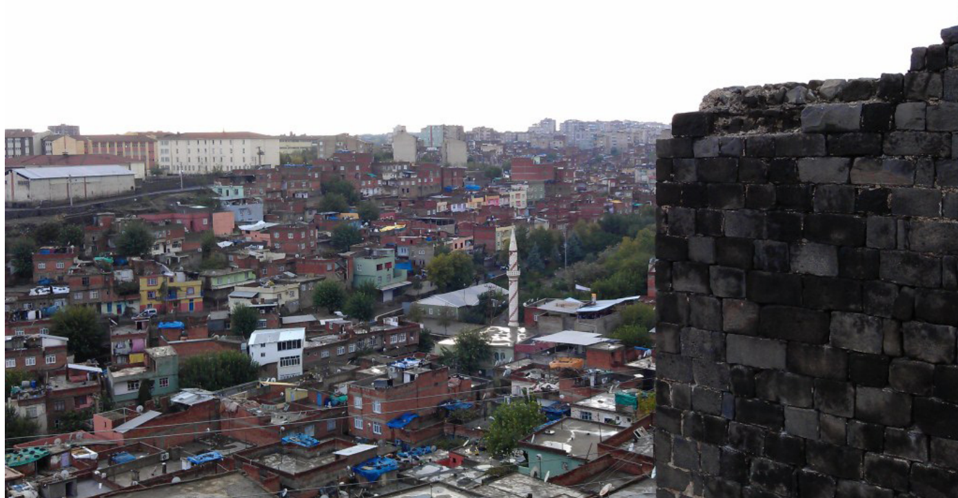
Изглед откъм старите стени на Диарбекир към бедните квартали.

Трябва да се каже, че главната опасност за турската полиция идва именно от стария град на Диарбекир и близките бедни квартали, които от групата нарекохме описателно “ диарбекирски фавели ” - подобно на бразилските гъсто заселени квартали, които представляват най-големия проблем за властите, заради ширещата се бедност и престъпност.