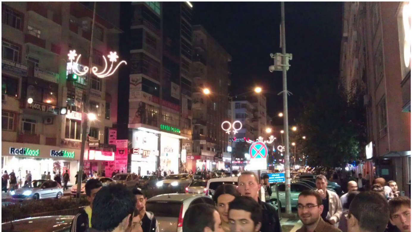
Част от новата част на Диарбекир, където младите искат забавления и забрава за проблемите.

Но всичко това не е достатъчно, за да спре желанието за живот в тези размирни части на Турция – нито за турците, нито за кюрдите. Важно е да се каже, че ПКК имат противници дори сред местните кюрди. Всъщност, те продължават да живеят заедно,