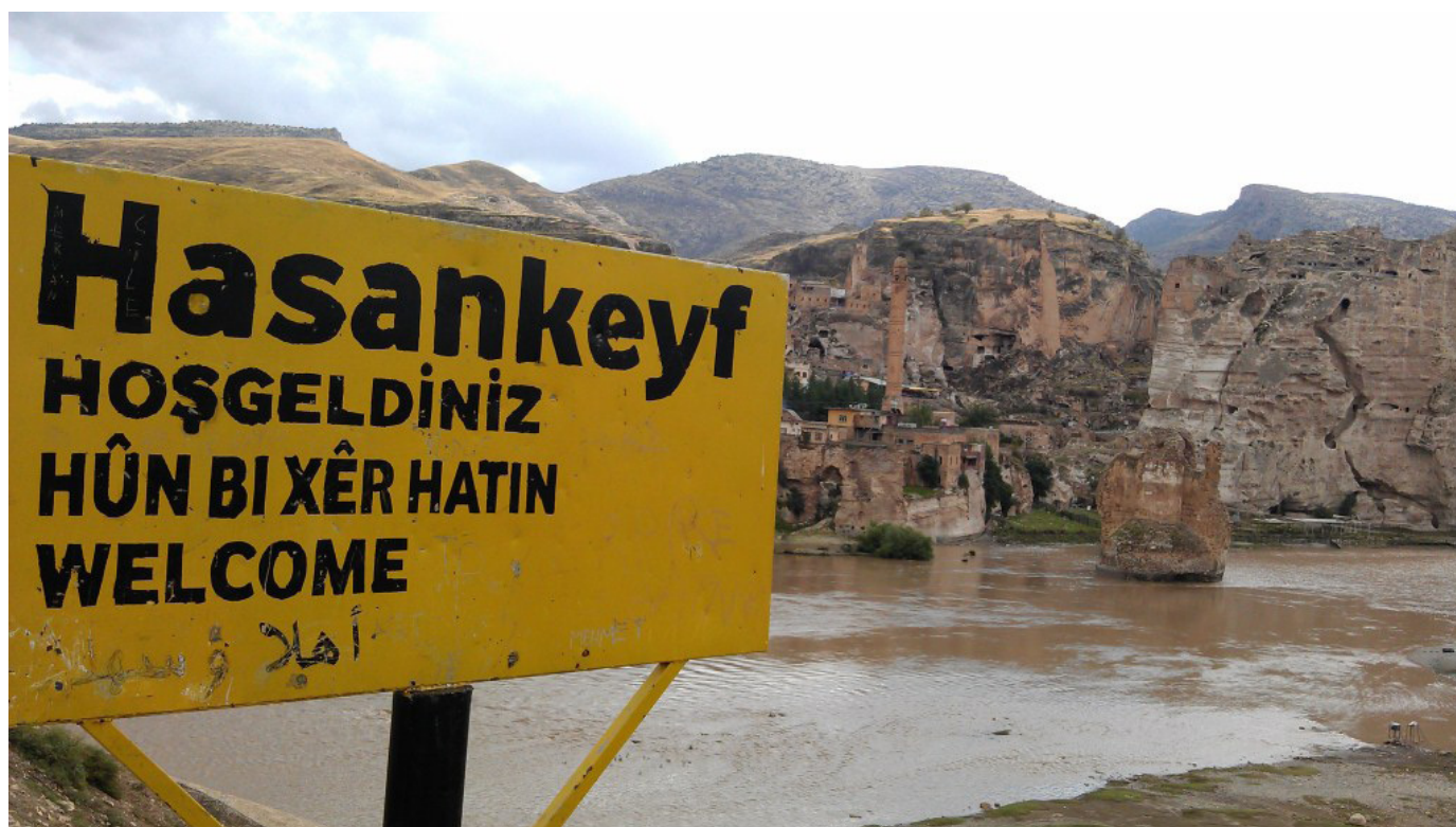
“Добре дошли” на турски, кюрдски и арабски език.

За запазването на древното селище Хасанкейф (на кюрдски – Heskîf) и района му има много кампании в миналото и днес. Причината за това е, че има реална опасност Хасанкейф