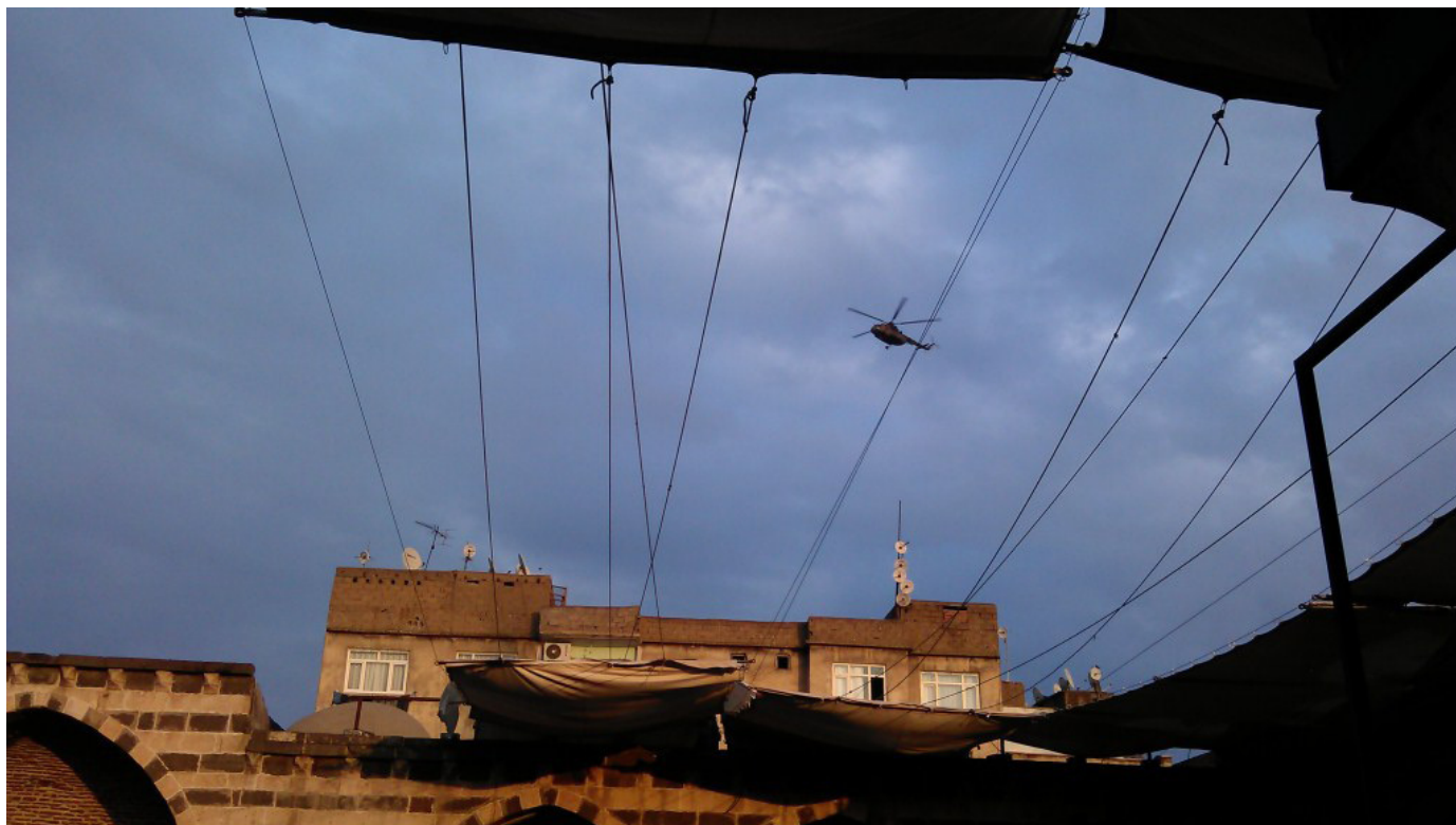
Тази снимка направих, докато седях в стария хан "Хасан Паша" в стария град на Диарбекир. Военните хеликоптери обикалят постоянно.