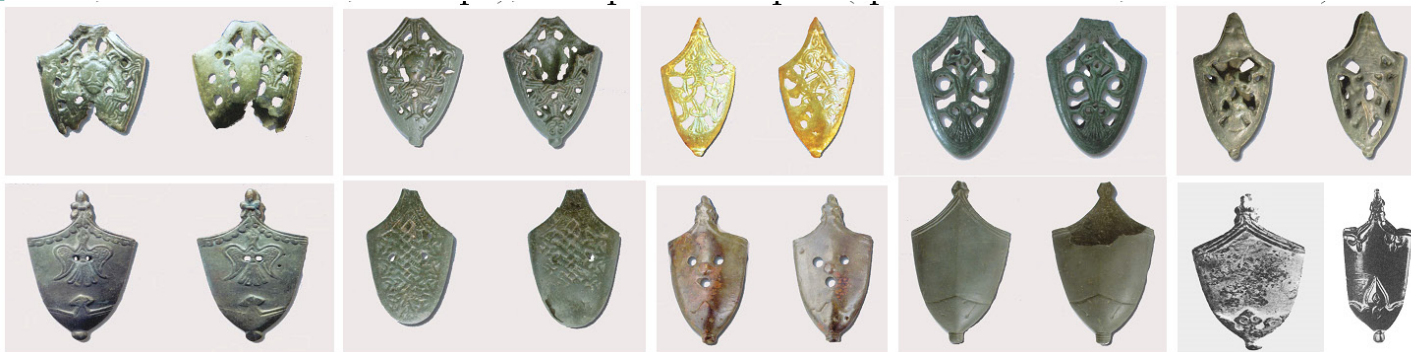
Фиг. 4 Накрайници на ножници за мечове от Североизточна България (Разградско, села Стана, Завет, Миладиновци, Мадара), Северна България (град Павликени, село Гиген)

и на отликите в неговата конструкция в сравнение с предходния меч. Докато този от село Опака е с изправен гард, то при този от село Градешница двете рамене на предпазителя са извити симетрично при двете страни. Третият меч е от село Говежда в Монтанско и се определя като един от най-западните мечове в средновековна България. Той е с дълговиден накрайник и прав предпазител, което го доближава по форма до късно – средновековните мечове в Европа от периода XII-XIV век според руския археолог А. Кирпичников 7 . Подобно на този от Градешница, третият меч е вероятно свързан и с походите на маджарите на Балканите, но това не понижава скандинавското влияние. Освен трите по-западени мечове, в североизточна България (не се знае по-точно местонахождение) е намерена и част от меч – острие, което по форма се доближава до тях и датира от втората половина на X век.