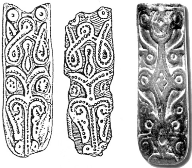
Фиг. 6 Ремъчни накрайници от Румъния (старинното селище Диногеция) и североизточна България