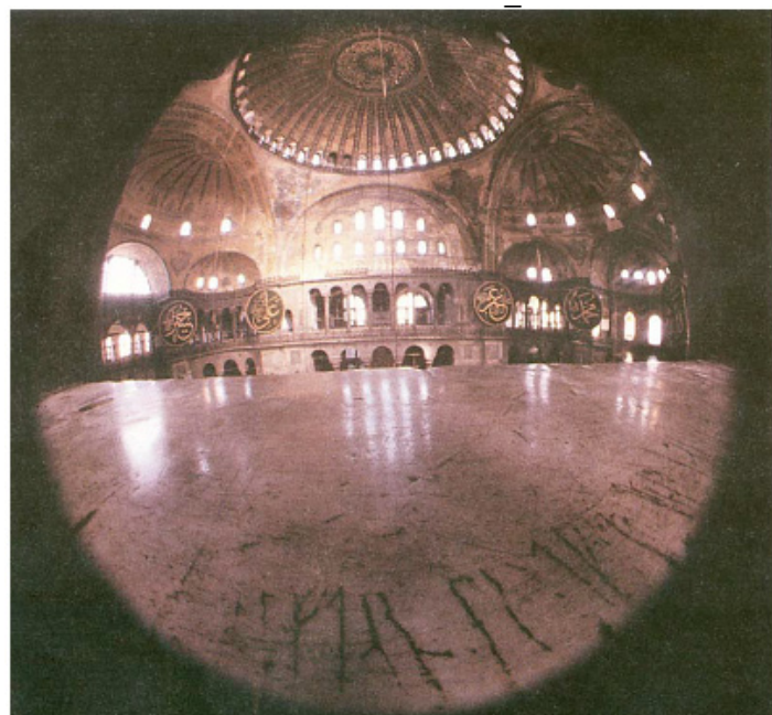
Фиг.7 Рунически надпис от Константинопол (катедралата Света София) с името на Халфдан, наемник във варяжката гвардия на византийския император Василий Втори.

Макар и да не изглежда точно като историческа находка (понеже не е конкретен артефакт или вещь), значимо свидетелство за присъствието на викинги на Балканите дава и рунически надпис на монументалната катедрала Света София в Истанбул (Фиг.7) Той е вероятно изваян от бъдещия норвежки конунг (владетел) Харалд Хардрад 1047-1066, който помогнал на византийския император Василий Втори Българоубиец да причини края на