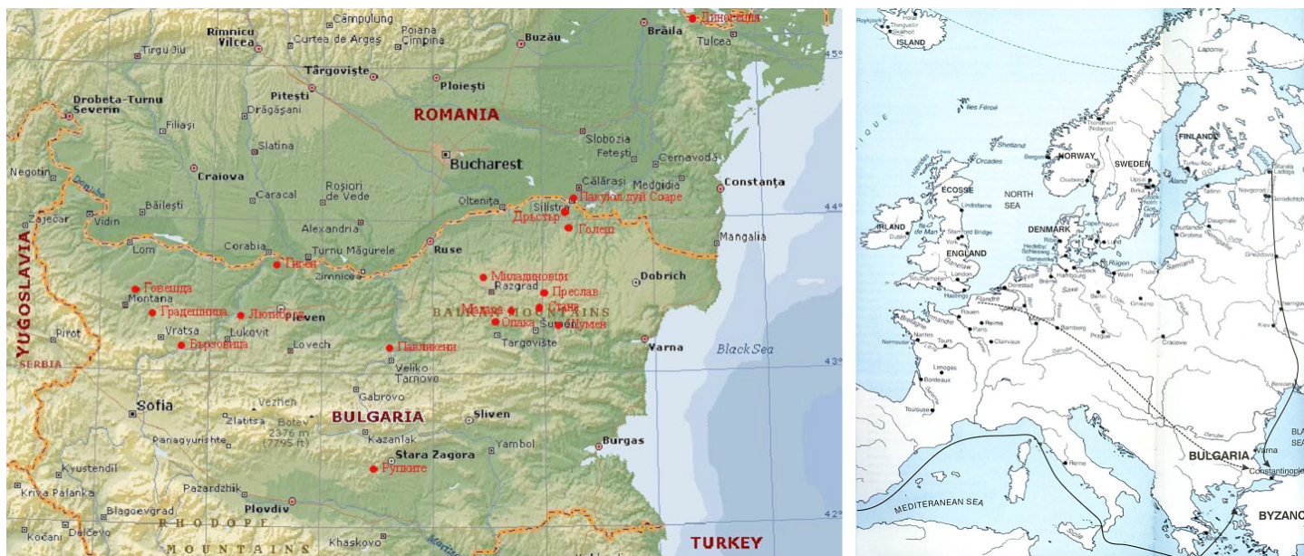
Фиг. 1 Разпространение на археологическите разкопки, свързани с варягите на Балканите (включително и България) – X-XI век и Днепърския воден път (“путь из варяг в греки”)

териалните сведения. Затова целта на втората статия със същото заглавие е да посочи визуално-материалните аспекти на присъствието на викингите в тази част на Европа (Фиг. 1) Все пак уместно е да се съчетае наративния с визуалния компонент в едно изследване, за да изградим доказателство. В частност, подчертахме, че е имало скандинавско присъствие на Балканите, но още не сме го доказали наглед, тоест визуално. Именно това следва да