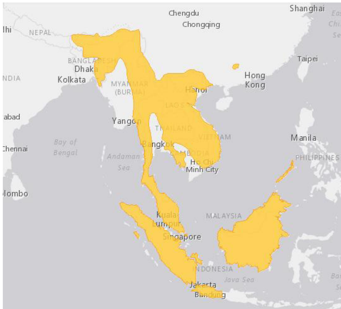
Фиг.1 Географско разпространение на бинтуронга.

Живеят по дърветата и са активни нощем. Движенията им са бавни и внимателни, не скачат, а с помощта на опашката лазят. Освен това са добри плувци и гмурци. Стъпят ли на земята, ходят като мечки, като стъпват на целите лапи, което е необичайно за другите вивероци. Бинтуронзите живеят поединично или в неголеми групи, състоящи се от двойки с по-