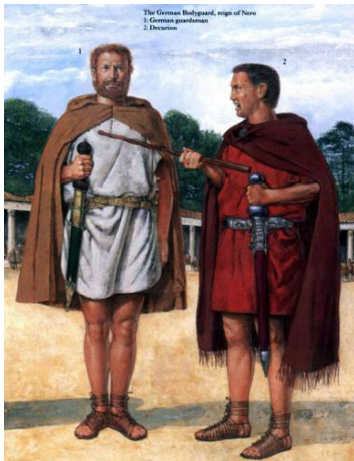
Германски телохранители/ Germani custodes corporis /.

За личната охрана на императора по време на Юлиево-Клавдиевата династия и семейството му се набирали и телохранители от германските племена /най-често батави/, които били фанатично предани на императора и го пазели от произвола на преторианците. Те били организирани подобно на спомагателните али в подразделение от 500 човека. Били разделени на декурии от по 30 човека, командвани от декурион. Лагерът им се намирал в района на градините на Долабела от другата страна на Тибър. След смъртта на Нерон през 68 година новият император Галба разформирал германските отряди и много от недоволните телохранители подкрепили въстанието на Цивилис в Галия, след потушаването на което тези подразделения повече не се споменават.