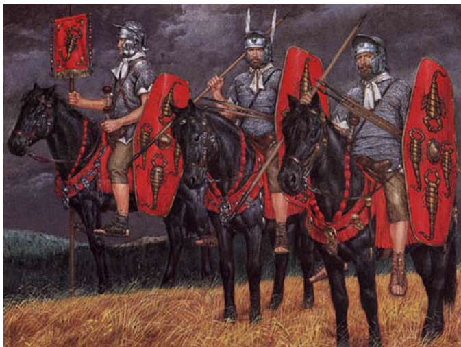
Преториански кавалеристи в Дакия 85 г.

За личната охрана на императора по време на Юлиево-Клавдиевата династия и семейството му се набирали и телохранители от германските племена /най-често батави/, които били фанатично предани на императора и го пазели от произвола на преторианците. Те били организирани подобно на спомагателните али в подразделение от 500 човека. Били разделени на декурии от по 30 човека, командвани от декурион. Лагерът им се намирал в района на градините на Долабела от другата страна на Тибър. След смъртта на Нерон през 68 година новият император Галба разформирал германските отряди и много от недоволните телохранители подкрепили въстанието на Цивилис в Галия, след потушаването на което тези подразделения повече не се споменават.