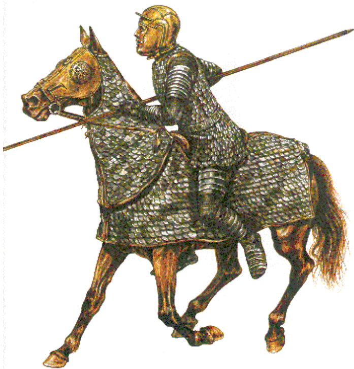
Cohors equitata и легионер 2 в.: