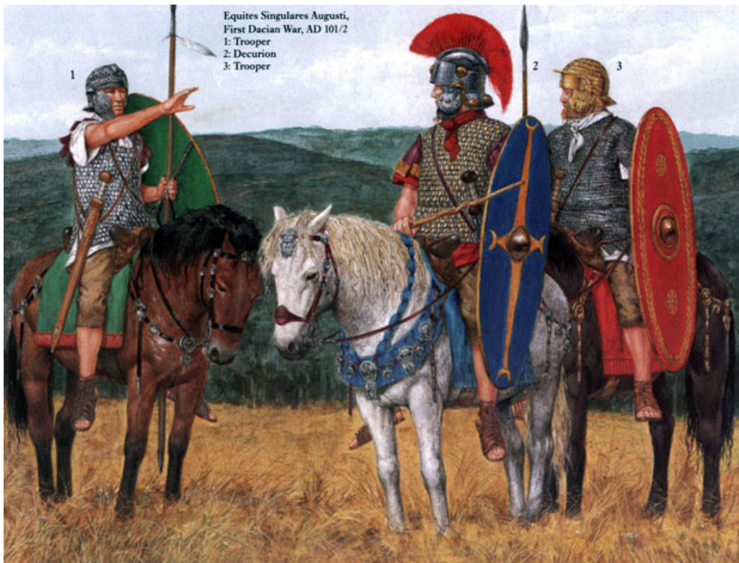
Equites singulares Augustii /Императорската конна гвардия/

Вексиларии/ vexillarii / били ветерани, прослужили повече от 16 или 20 години в римската войска, които