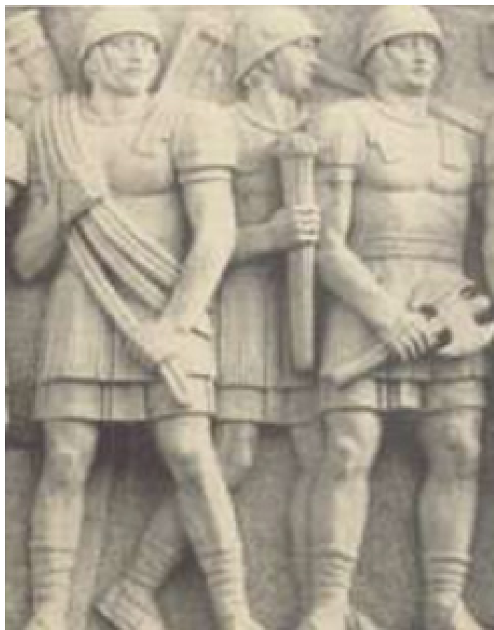
Вигилите Vigiles Urbani

Градските кохорти Cohortes urbanae /Намирали се под началството на praefectus urbi - градския префект. Тези кохорти били създадени в началото на 1 в. от император Октавиан Август, едновременно с преторианските и номерацията им започвала от X - .... /за разлика от тези на преторианските - I - IX/. Император Клавдий увеличил броя им. При Веспасиан /69-79 г./ в Рим били оставени 4 кохорти, а останалите - пратени в Картаген и Лугудунум /Лион/, за да пазят императорския монетен двор. Службата в градските кохорти била 20 години.