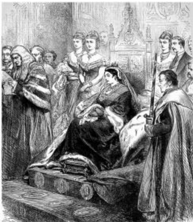
Кралица Виктория старва работата на английския парламент, от The Illustrated London News on 17 февруари 1877 г.

Още по-красноречиви за външната политика на Виктория, са цитираните вече нейни думи за противопоставянето ѝ на Русия в началото на войната: „Не се касае за подкрепа на Турция, касае се за руско или британско първенство в света!” Както и написаното в едно писмо до Бийкънсфийлд от 7/19 януари 1878 г., когато руските войски са вече пред Одрин: „Ние ще бъдем навеки обезчестени, ако приемем окупацията на Галиполи, или атака върху Цариград!”