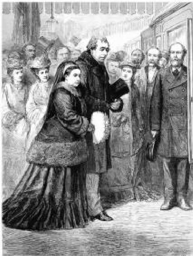
Кралица Виктория и лорд Бийкънсфийлд се отпращат към Хоувънския мост, сп. The Graphic от 23 декември 1877 г.

Заседанието на 5/17 декември било много бурно, но след два часа и половина дискусии пак нищо не било решено. Бийкънсфийлд заявил, че ще си подаде оставката. По време на дискусията станало ясно, че Дарби, Карнарвън и Солсбъри реално не искали Англия нито да се противопоставя на Русия, нито да помага на Турция. Направено било ново отлагане на заседанието за следващия ден.