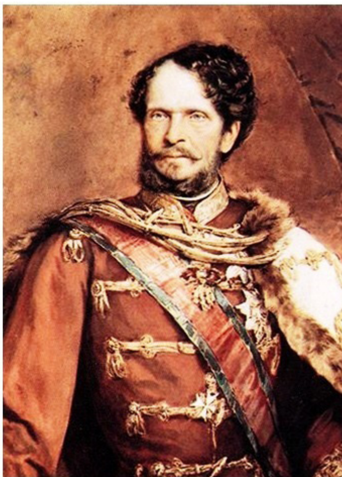
Граф Дюла Андраши

рителните условия за сключване на мира. Взети били решения за оказване на дипломатически натиск върху руското правителство в защита на австроунгарските интереси. Основното възражение било срещу създаването на голяма славянска държава в лицето на българската държава. Андраши виждал заплаха в това действие, тъй като считал, че тази голяма държава ще бъде съюзник на Русия, и така тя на практика ще бъде господар на Бал-