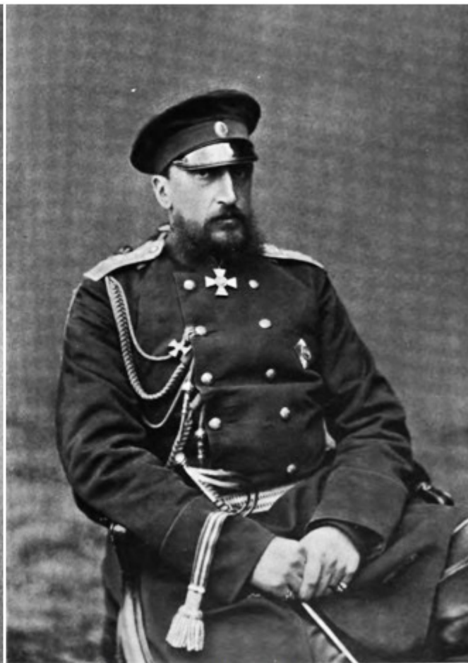
Велик княз Николай Николаевич