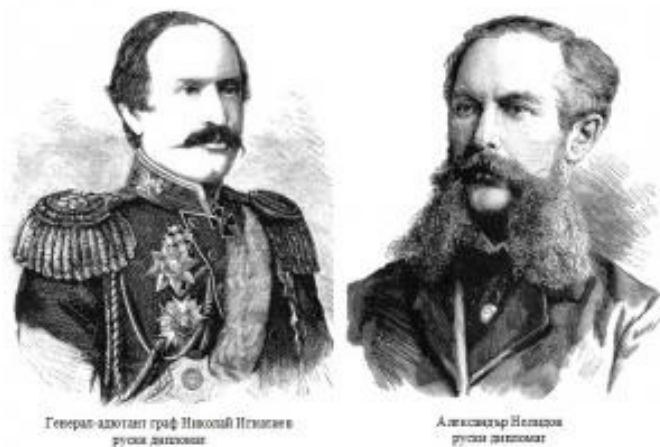
Генерал-адютант граф Николай Игнатиев руски дипломат

Игнатиев характеризира състоянието на Горчаков по време на престоя си в Букурещ с думите: „Оценките на канцлера ми направиха много тежко и неприятно впечатление. Той се отнасяше към всичко с пълно равнодушие, предоставяйки събитията сами да следват своя ход: не искаше нищо да прави, нито да предприеме нещо, говорейки, „че всичко това крайно му дотегнало” и придавайки на всичко изключително личен и икономически характер. Беше ясно, че в такива ръце всички интереси на Русия рискуват да бъдат незащитени или пожертвани, особено при такива безсрамни, безсъвестни и предприемчиви съюзници като граф Андраши и Братияну.”