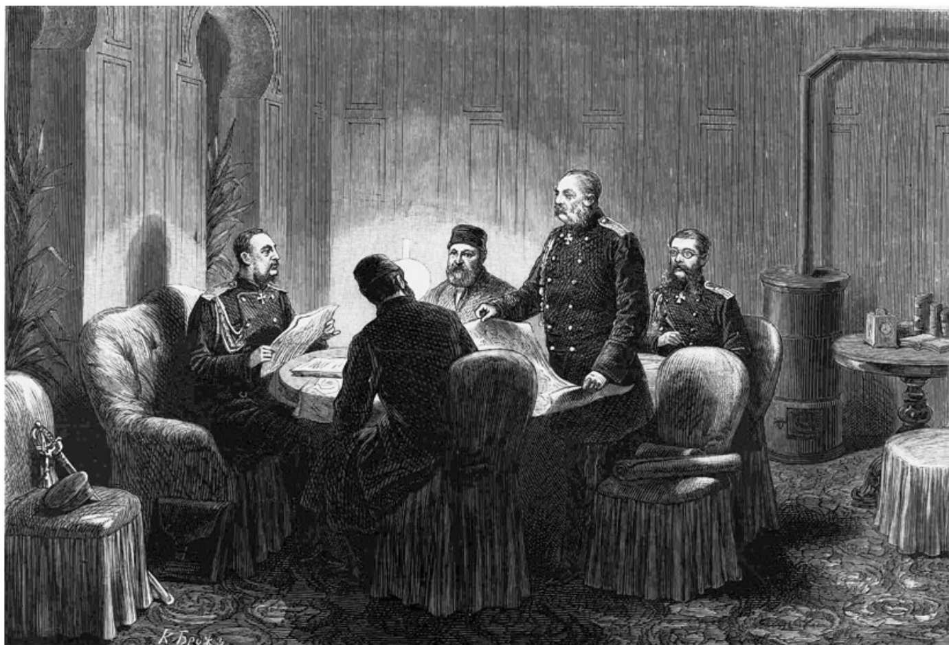
Подписване на примирието между Турция и Русия, 19/31 януари 1878 г., Одрин. Отляво-надясно: Н. Николаевич, Намък паша (в гръб), Сервер паша, А. Непокойчишки, Ал. Нелидов. Сп. Иллюстрированная хроника войны от 1 април 1878 г.

Една телеграма на Николай Николаевич 8/20 февруари разкрива, че в Одрин турските пълномощници са хитрували. „Намък и Сервер паша, както