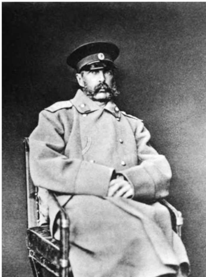
Император Александър II

На 30 декември/11 януари в състава на турското правителство била извършена промяна. Великият везир Едхем паша, привърженик на войната, бил сменен с по-миролюбивия Хамди