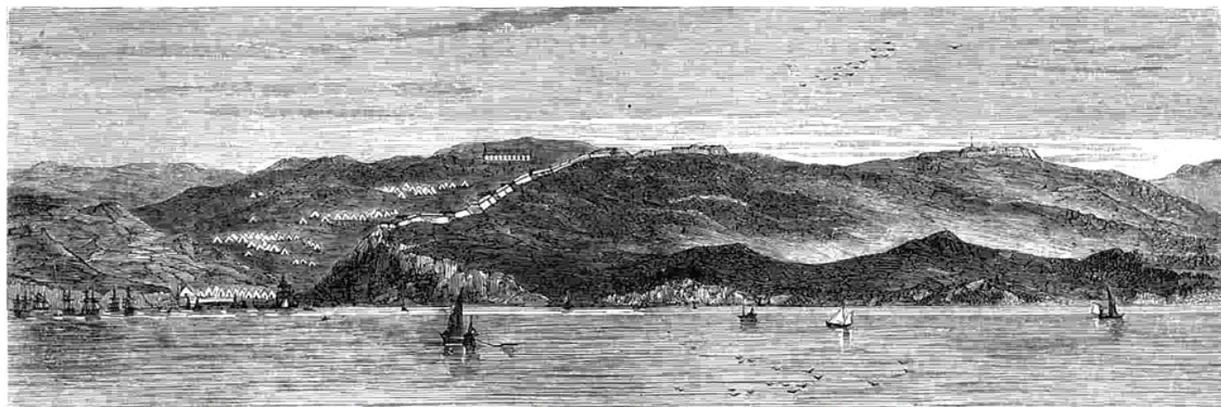
Укрепленията при Булаир за защита на полуостров Галиполи, сп. Всемирная иллюстрация от 20 май 1878 г.

Затова английският пръв министър условно проектирал тези си намерения за „една друга кампания”, т. е. за следващата година, очаквайки, че затруднени в напредването си към турската столица, руснаците ще прекратят действията си и подсилени с още войски през следващата пролет отново ще подновят кампанията си с „втори поход”. И наблегнал на опасността руските войски да преодолеят временните затруднения и същата есен да стигнат до Одрин.