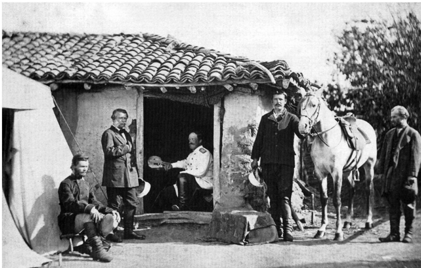
Граф Николай Игнатиев в главната квартира в Горна Студена, септември 1877 г.