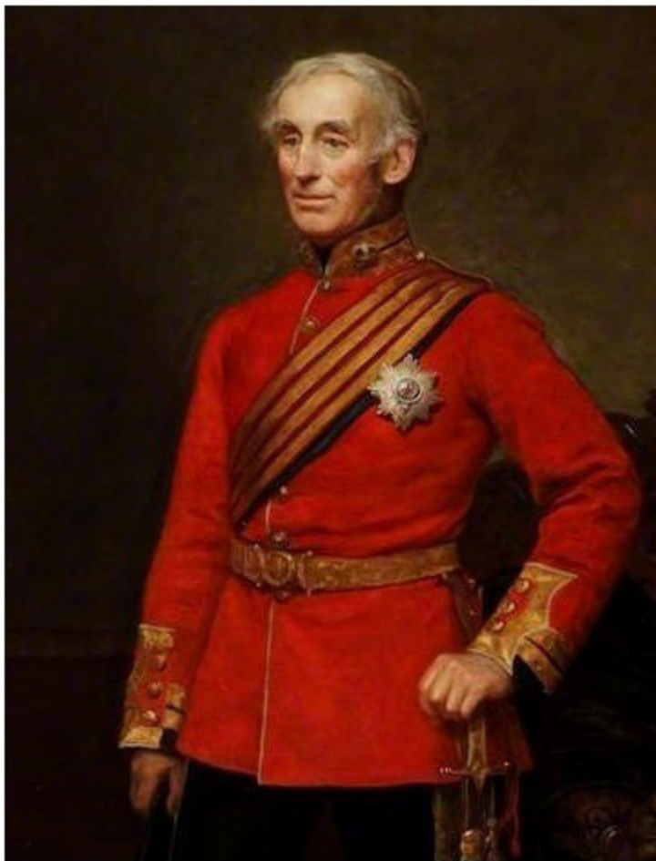
Артър Уелсли английски офицер и дипломат

готова. Което насочвало до мисълта, че Русия трябвало да приключи военните действия до края на есента. Руският дипломат останал с впечатлението, че и императорът бил на това мнение.