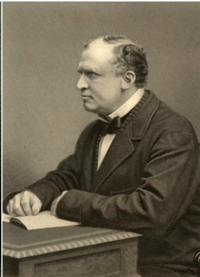
Едуард Хенри Стенли лорд Дарби външен министър на Великобритания