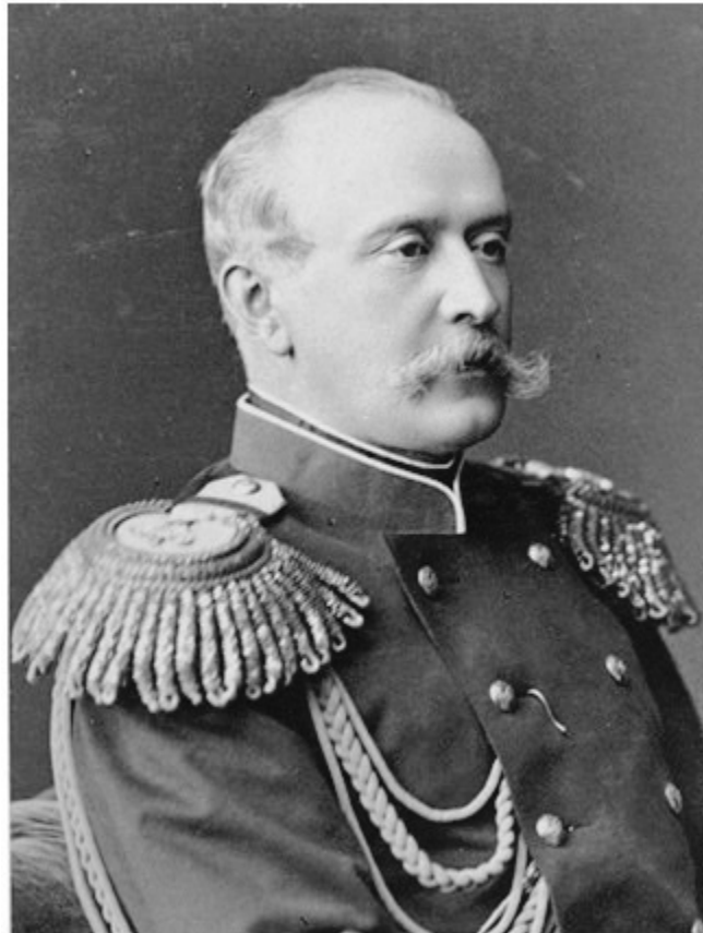
Граф Пьотр Шувалов руски посланик в Лондон

В края на записката била изразена и добронамереност, като било посочено, че политиката на английското правителство съответствала на уверенията, дадени от руския император в Ливадия (на 21 октомври/2 ноември 1876 г.), че той няма намерение да превзема Цариград. И ако по необходимост бъде