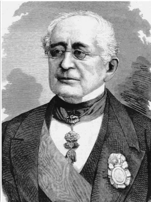
Княз Александър Горчаков канцлер и външен министър на Русия