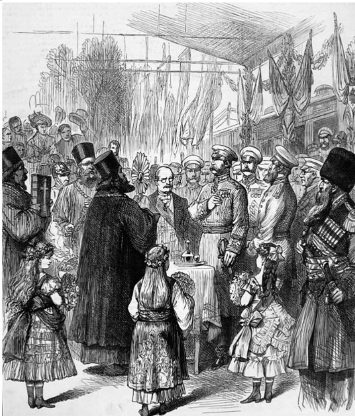
Посрещане на руския император Александър II на гарата в Плоещ, Румъния, сп. The Illustrated London News от 23 юни 1877 г.

Обявяването на независимостта на страната и включването ѝ във войната било посрещнато с удовлетворение от руското правителство. От една страна то вече имало възможност да разшири значително линията на настъпателните операции. От друга страна на Европа станало ясно, че и Германия съчувства на Русия, тъй като всички добре разбирали, че румънският княз Карол не би се решил да приеме участие във войната, без да е получил поощрение от Берлин.