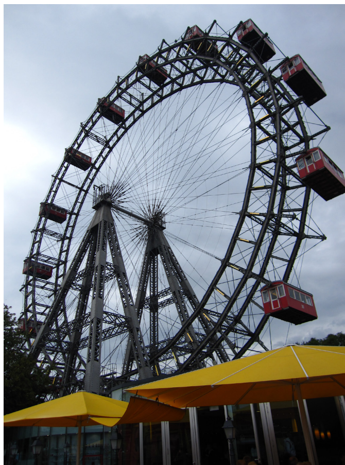
Прочутото Виенско колело, Пратера

ти! Покрай тебе препускат множество коли, а с тях и възможностите да стигнеш закъдето си тръгнал. Е, зависи колко си гладен! Та сега усетихме глад най-сетне. Хапваме спокойни и доволни, че сме достигнали първата точка от маршрута. Не сме само ние. До нас имаше цяло семейство, които също си бяха наизвадили кутии с паста и обядваха. От другите двама (стопаджии) получаваме SMS, че ще пристигнат след няколко часа, и се разбираме да се чакаме на входа на Пратера.