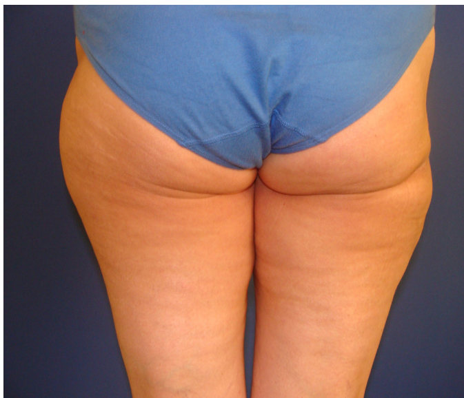
фигура 3. След (късен резултат)