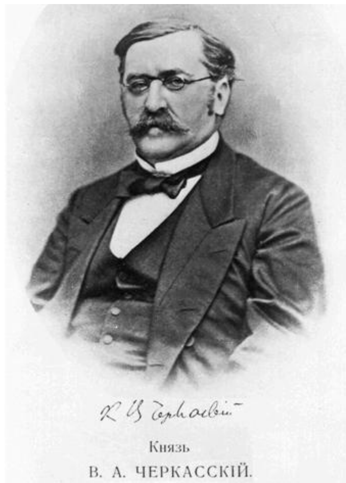
Княз Владимир Александрович Черкасски (1824-1878).