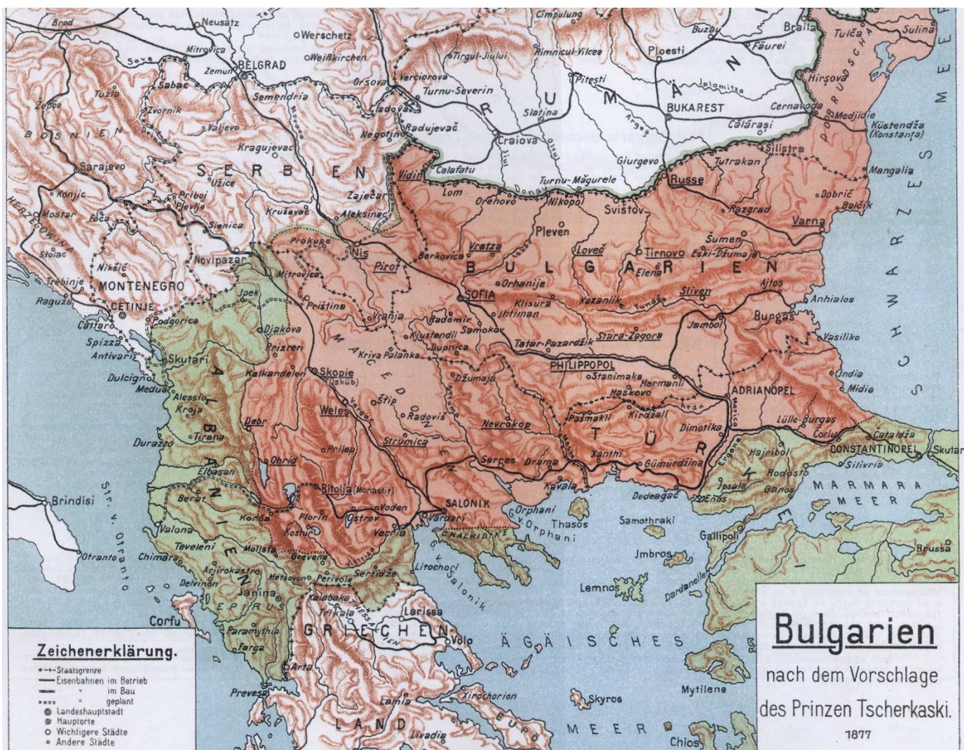
Карта на България, съставена според вижданията на княз Владимир Черкаски относно нейните граници.