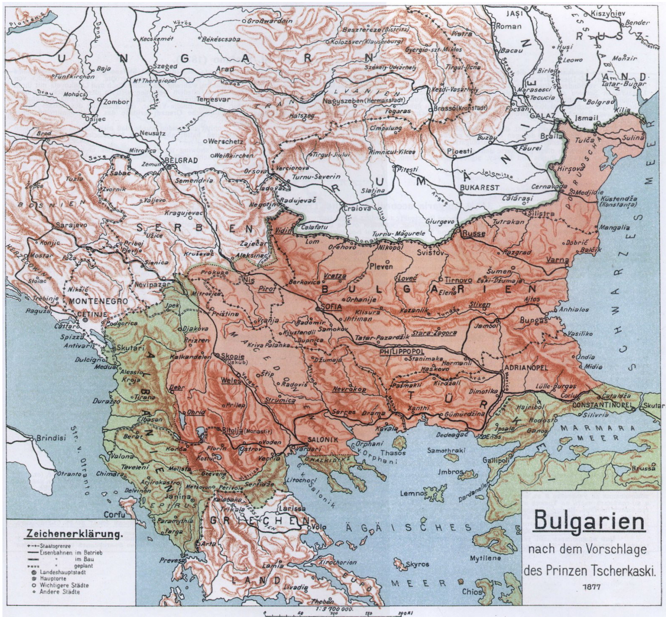
Карта на България, съставена според вижданията на княз Владимир Черкасски относно нейните граници.

Със споразумението с Австрия вече е набелязана съдбата на западните области на Турция. На нас не ни е необходимо да отстъпваме от това споразумение. Нека Австрия да вземе за себе си Босна и Херцеговина; само Сърбия и Черногорието да получат уговорените за тях територии. За Албания също няма какво особено да се грижим: каквото предложи Европа, това и ще приемем. Но след това, съдбата на