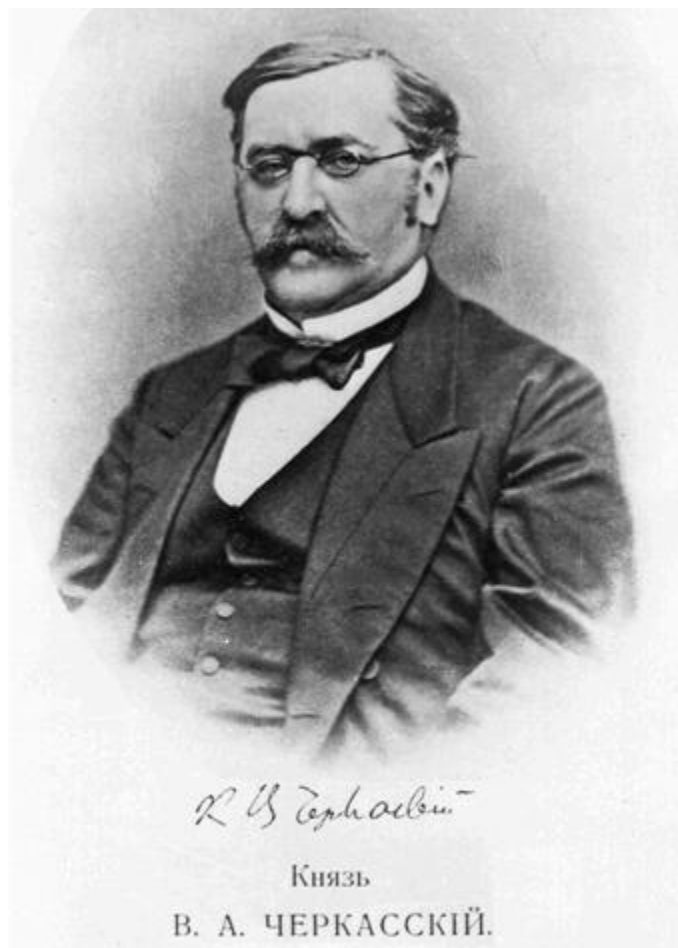
Княз Владимир Александрович Черкасски (1824-1878).

официалните документи: Канцелария за граждански дела при главнокомандващия на Действащата армия на Балканите. Същия ден е утвърдена и секретна инструкция за специалните задачи, възлагани на изпълняващия новоучредената длъжност, а на 21 ноември с. г. последвала нова заповед,