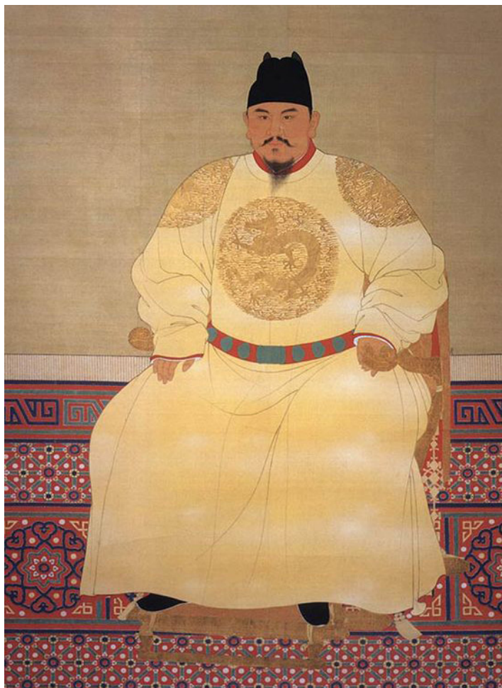
Император Хуну - Възстановителят на Китай, който прогонил монголите и поставил началото на нова династия

те забрадки”. Използвайки интриги, сила и измама, Джу успява да елиминира своите съперници и поема пълен контрол над фракцията, след което се заема да подчини и останалите бунтовнически лидери в южната част на Китай.