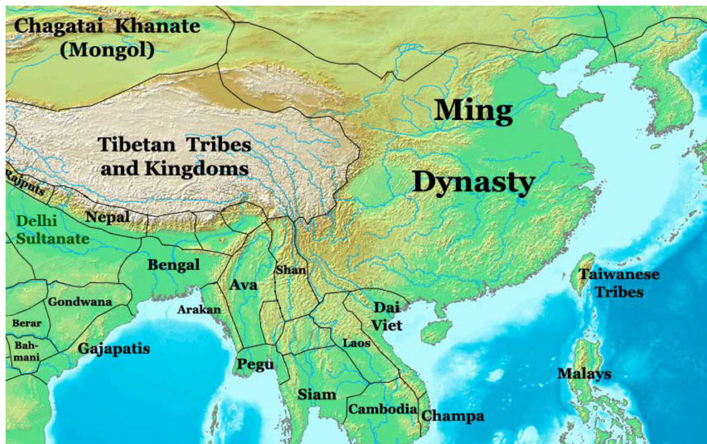
КАРТА – КИТАЙ И ЮГОИЗТОЧНА АЗИЯ 1418-49г.

Рен бил победен, а синът му, останал без подкрепа от местните вождове, бил предаден. Въпреки това, кампанията не донесла никакви финансови или териториални придобивки за Китай и завършила с ново пренапрягане на хазната и загубата на още войници. Но най-голямото изпитание за династията Мин тепърва предстояло. След края на кампаниите в Юнан, императорът, съветван от своите евнуси, лично се заел с отбраната на крепостта Туму. Битката била изгубена и Чжентун (Чжу Цичжен 1435-1449 г. и 1457-1464 г.) бил пленен от монголите-ойрати. Това предизвикало династична криза, последвана от междуособици, които разтърсили Китай в продължение на седем години, Чжентун се завърнал в Китай през 1450г. с благословията на монголите, което спокойно