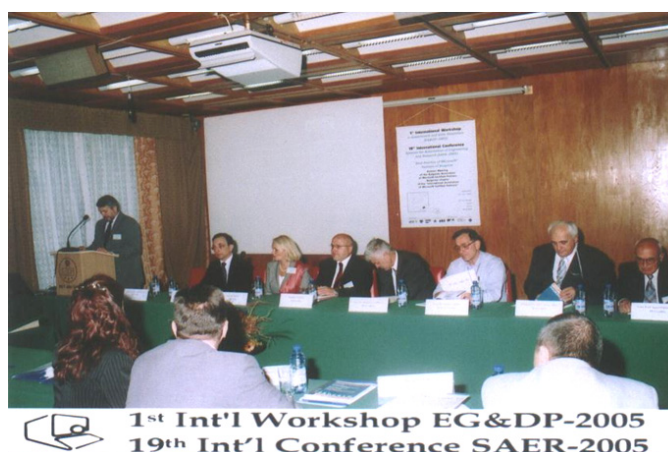
Снимка 1. Официално откриване на форума