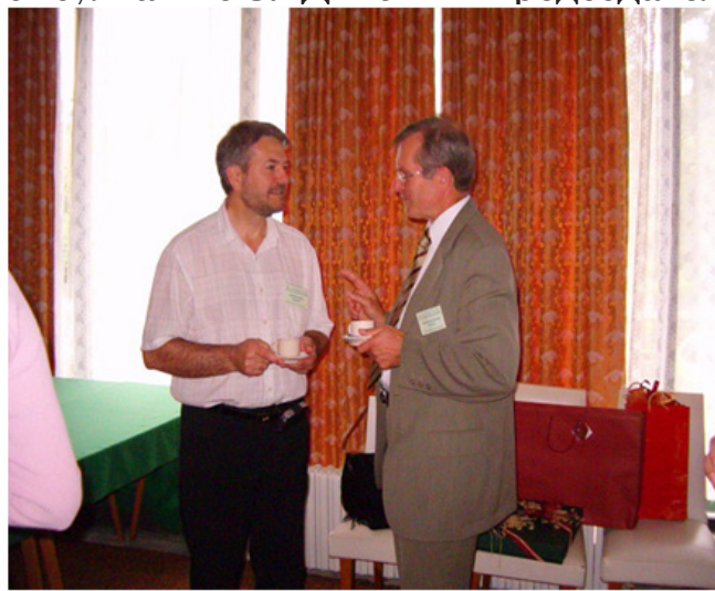
Снимка 2(а, б). Разговор по въпроси на приложението ИТ при ЗЛД