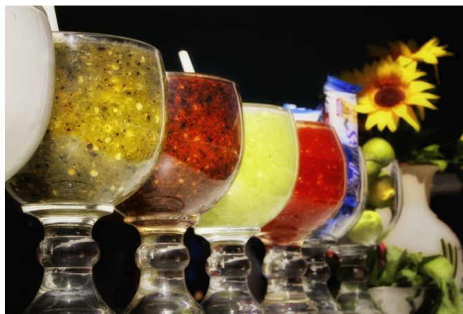
Фиг. 1 – Salsa! by Richard P Schoettger –