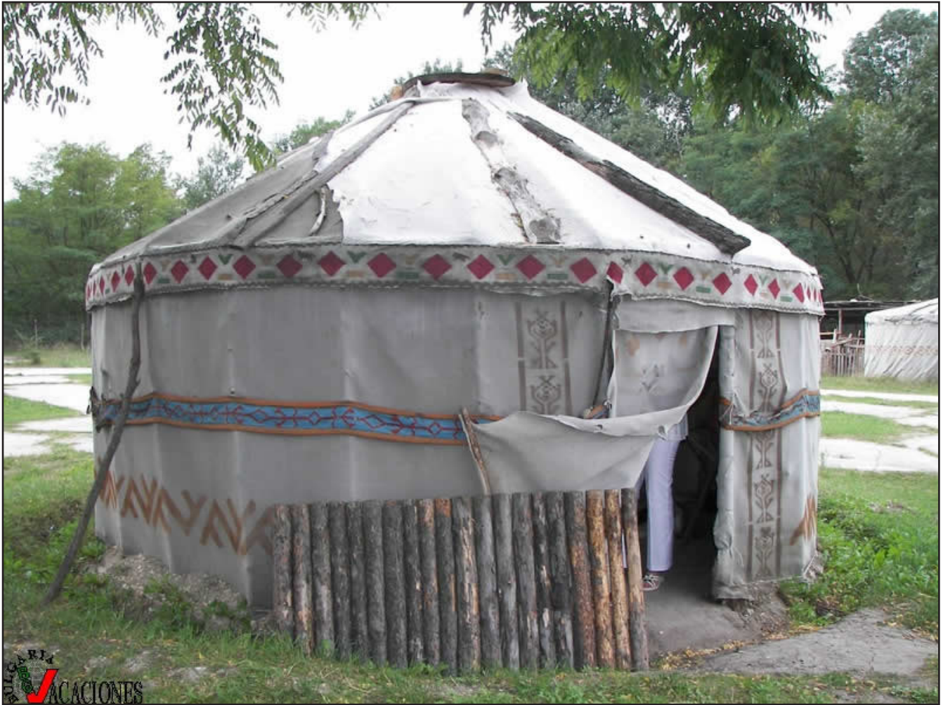
Прабългарска юрта в комплекс „Фанагория“

персите врагове на ромеите. Такива са походите от 488/489, 503, 504-508, 515, 521, 531, 550, 552 г. По време на този от 515 г. като съюзници на персите българите воюват чак в Сирия. В 552/553 г. обаче отношенията между Персия и Суварската конфедерация се влошават необратимо и се стига до война, вследствие на която много суварски, барсилски и български пленници са заселени от персите в южноарменската област Сюник (където българите основават провинцията Балк с 2 селища на име Вананд) и в Муганската равнина в днешен Южен Азербайджан, където доскоро или и сега съществуват хидронимът Болгаручай (Българска река) и селищата Болхар, Болгар, Болгаркент, Болгар-кок-тепе.