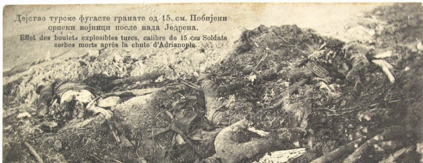
Дејство турске фугасте гранате од 15. см. Побјени српски војници после пада Једрена. Effet des boulets explosibles tures, calibre de 15 cm Soldats serbes morts après la chute d'Adrianople.

Заседанията на подновената Лондонска конференция обаче отново се