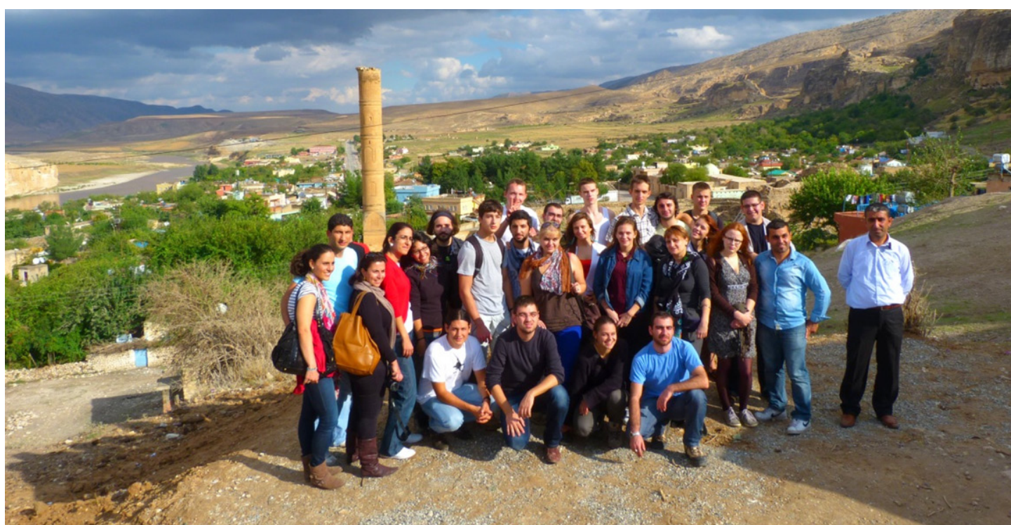
Обща снимка на участниците в Хасанкейф.