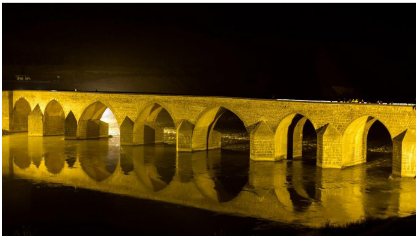
Мостът "Десетте божи очи" в Диарбекир