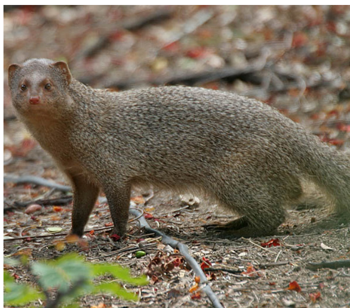
Индийска сива мангуста (Herpestes edwardsii)