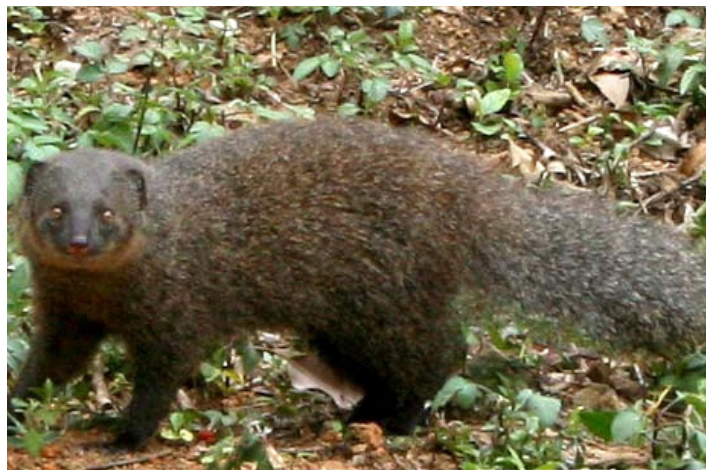
Индийска кафява мангуста ( Herpestes edwardsii )