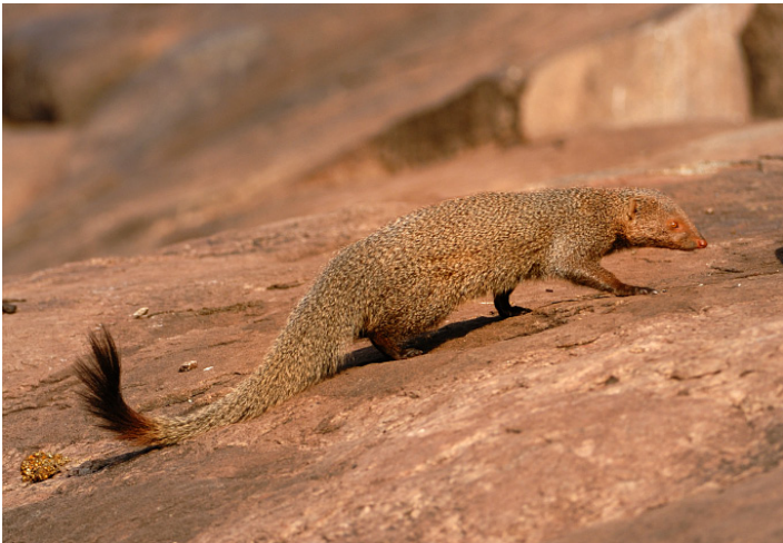
Червена мангушта (Herpestes smithii)