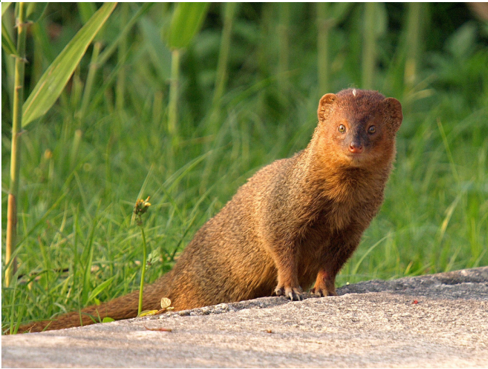
Яванска мангушта (Herpestes javanicus)