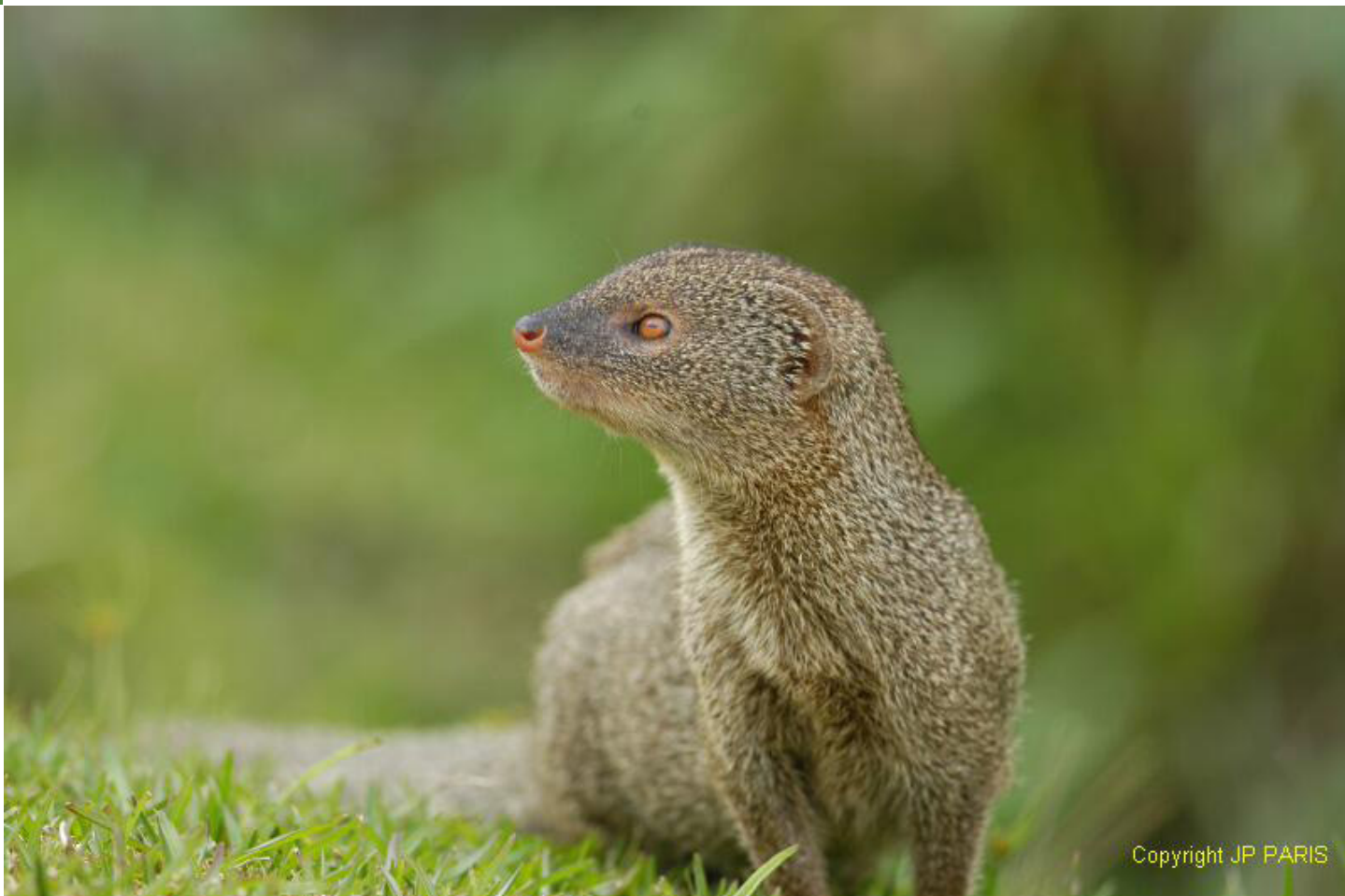
Малка индийска мангуста (Herpestes auropunctatus)