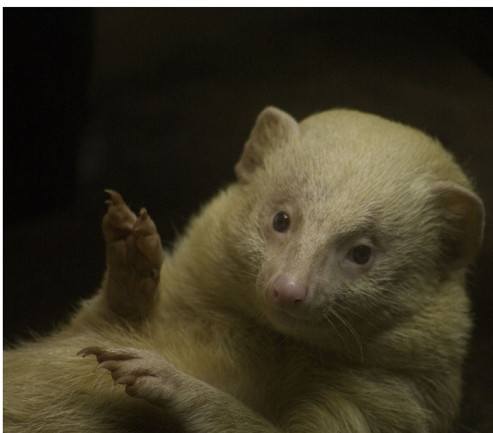
Късоопашата мангуста (Herpestes brachyurus) бяла мутация, нормалната окраска е тъмнокафява