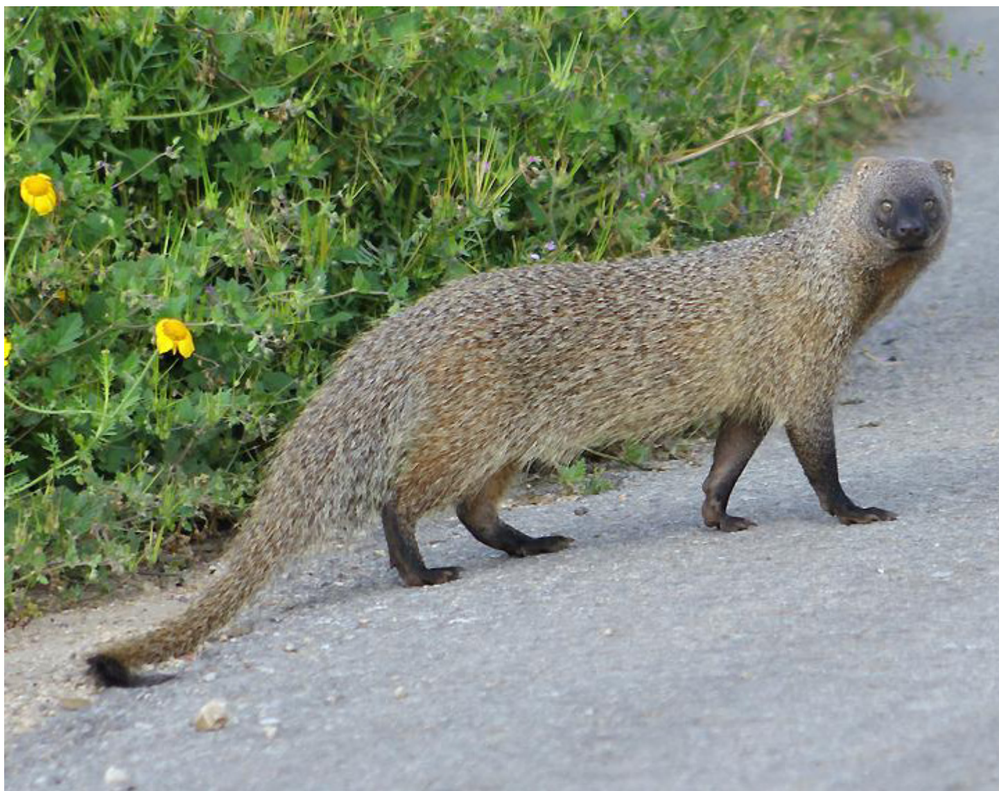
Ихневмон ( Herpestes ichneumon )