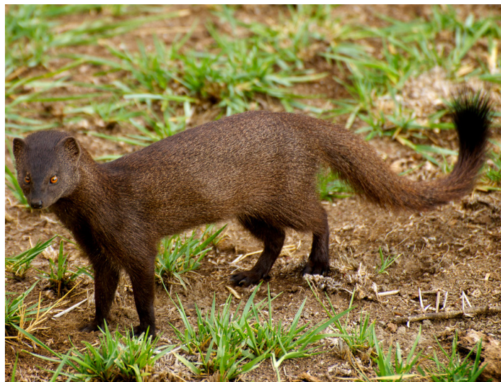
Дългоноса мангусти (Xenogale naso)