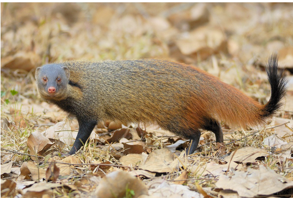
Ивичестошия мангушта (Herpestes vitticollis)