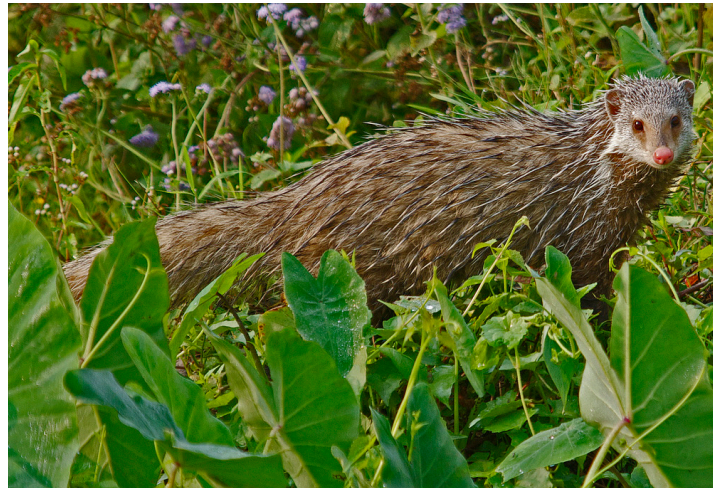
Мангушта ракояд (Herpestes urva)