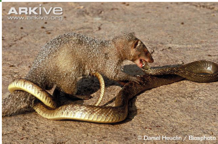
Индийска сива мангуста ( Herpestes edwardsii ) нападаща змия