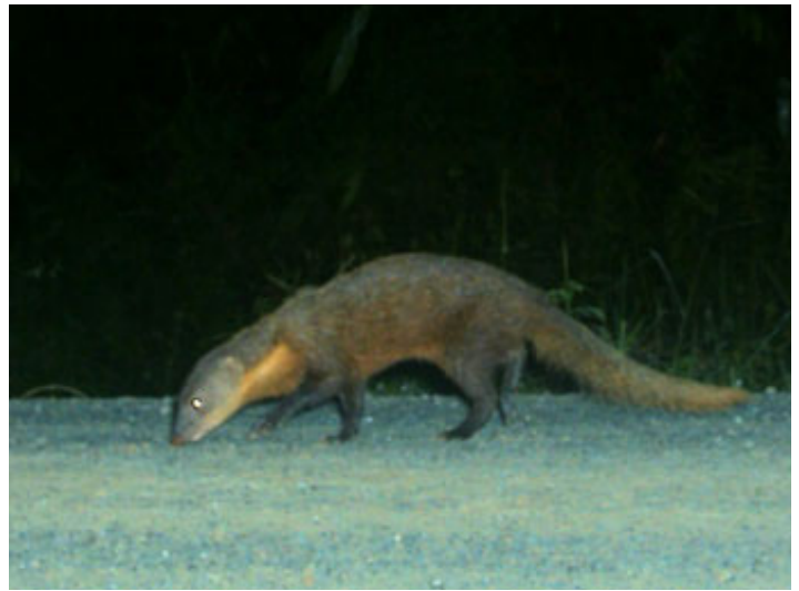
Огърличена мангушта (Herpestes semitorquatus)