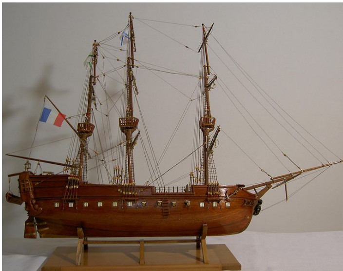
Реплика на кораба „Географ“.

държавата. През юли 1800 г. сметките са уредени и корабът е вече на вода и официално под френски флаг. На 23 август същата година получава новото си съдбоносно име – „Географ“.