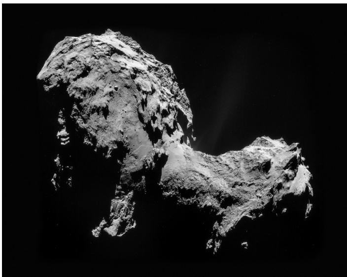
Кометата „67P“ или още „Чурюмов – Герасименко“

На 511 000 000 км. от земята, сондата ще установи десет радиоспектрометри, в опит да се провери дали теорията за това, че комети са „докарали“ водата на Земята и така са сложили началото на живота на планетата ни.